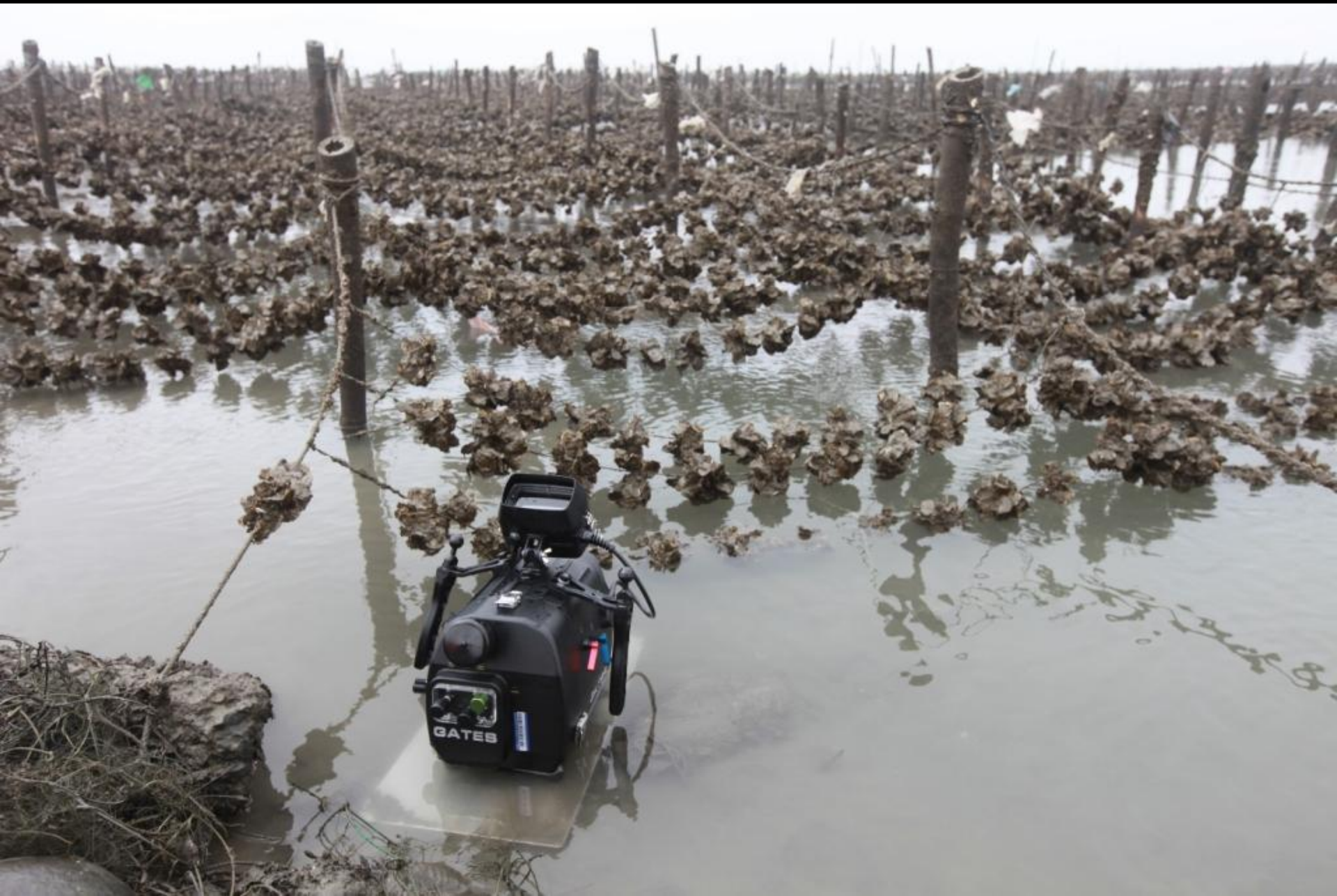
拍攝作業-EX1與防水殼