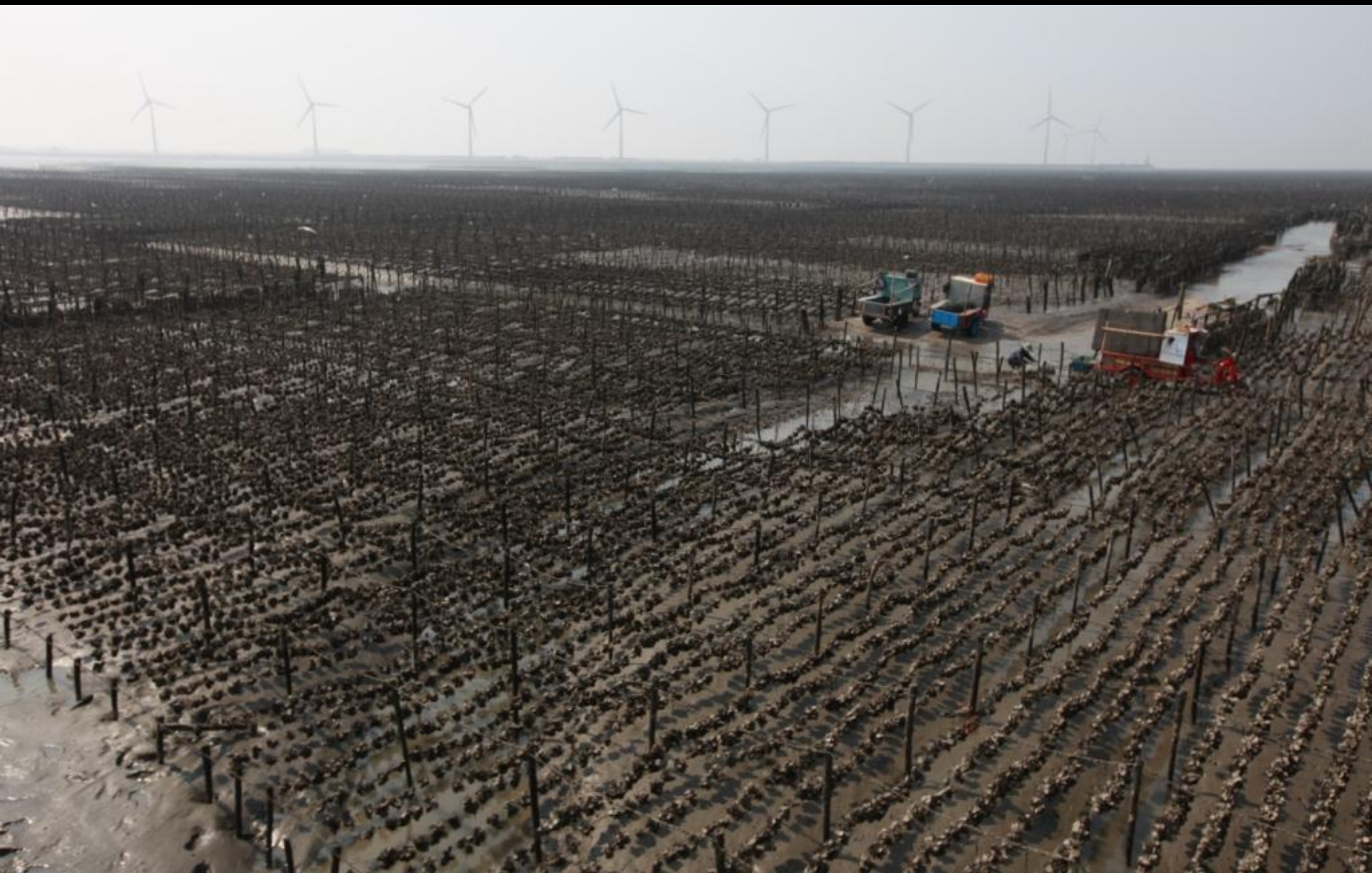
芳苑地區牡蠣養殖