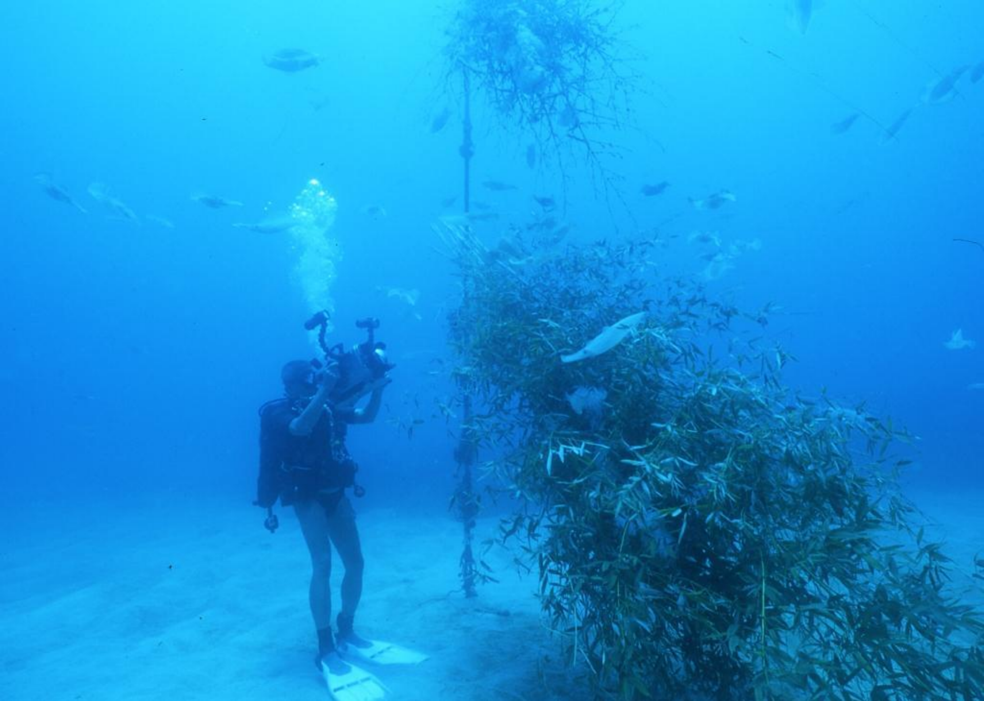
拍攝作業-水下工作