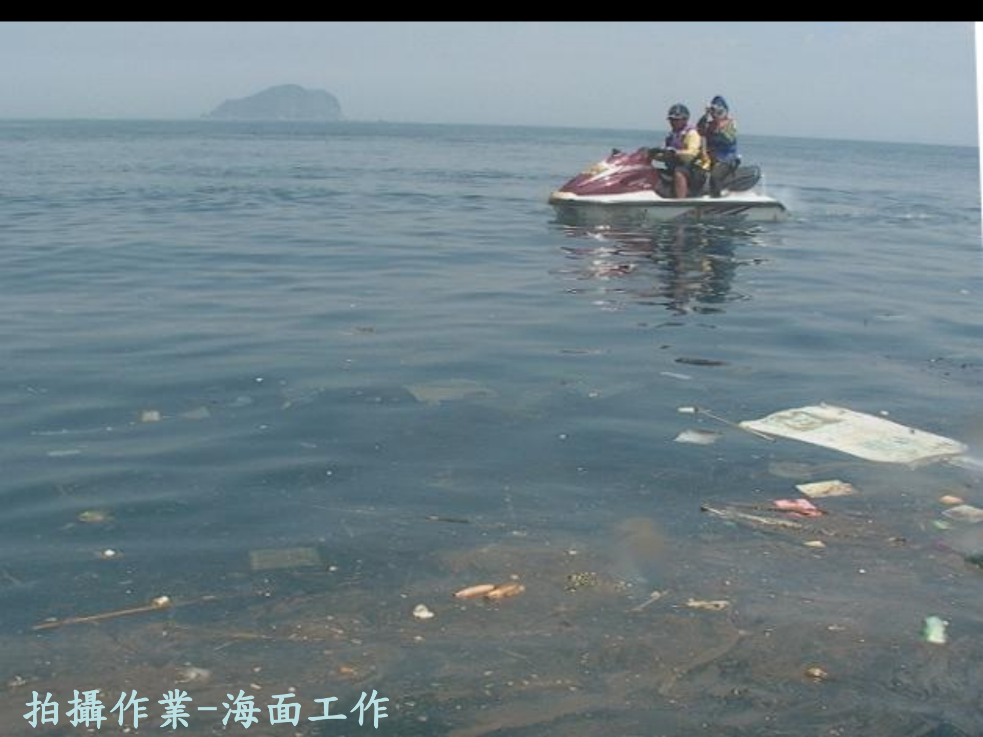
拍攝作業-海面工作